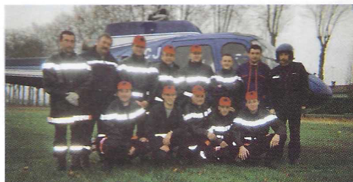
Recherche d'enfant disparu avec l'aide de la gendarmerie et un membre de l'équipe cynophile de Villeneuve-sur-Lot.