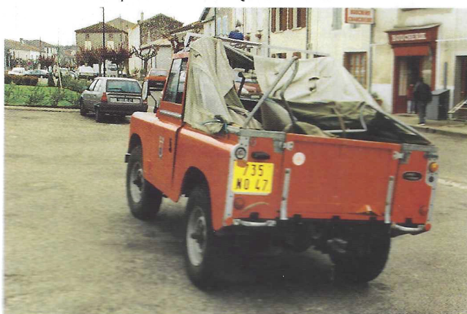
Le Land-Rover, victime de la tempête. D'où l'expression : «Prendre un pin...»