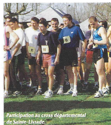
Participation au cross départemental de Sainte-Livrade.