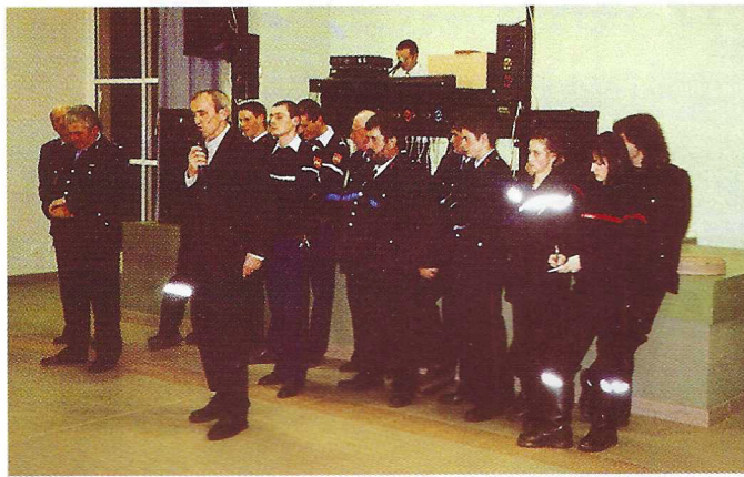
Discours du Maire.