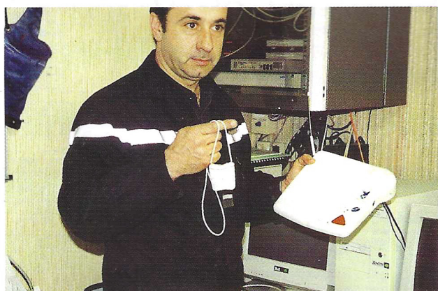
Installé chez l'abonné Le transmetteur est l'appareil qui permet de déclencher à distance, par une simple pression sur la télécommande la chaîne de solidarité et de secours.