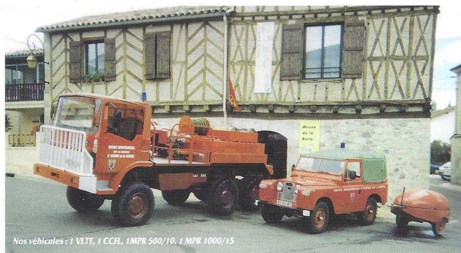
Nos véhicules : 1 VLT, 1 CCFL, 1 MPR 500/10, 1 MPR 1000/15