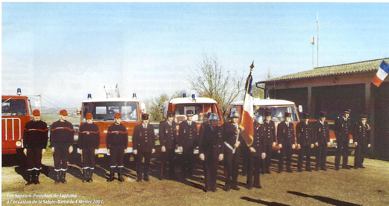
Les Sapeurs-Pompiers de Laplume à l'occasion de la Sainte-Barbe le 4 février 2001.